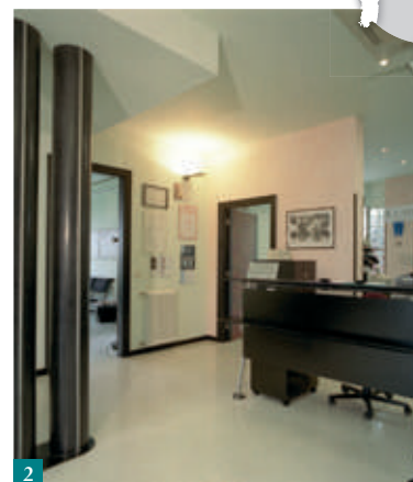
1. LA SALA STERILIZZAZIONE. 2. RECEPTION. 3. LA SALA ORTODONZIA.

Il suo studio di Monfalcone è uno studio molto grande e un po' particolare: come è nata questa idea?